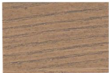
W04 NOCE CHIARO