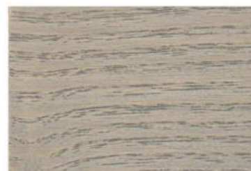
W18 PAU GRIGIO