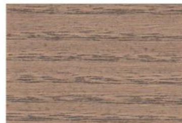
W06 NOCE SCURO